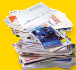
Tous les papiers

Inutile de les laver, il suffit de bien les vider.