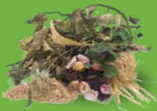
Brindilles, fleurs fanées, feuilles mortes, broyat