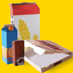
Emballages et briques en carton