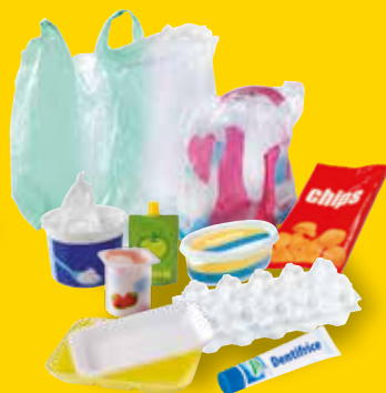
Tous les autres emballages en plastique