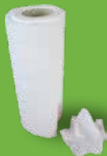
Serviettes en papier Essuie-tout