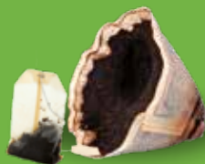
Marc de café, sachets de thé